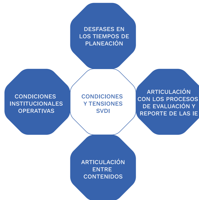
Figura 3. Tensiones relacionadas con la implementación del SVDI

Por último, las maestras y los maestros evidencian tensiones relacionadas con las condiciones para la implementación del Sistema de Valoración del Desarrollo Infantil -SVDI por varias razones (ver figura 3), y que se relacionan con las Instituciones Educativas -IE, los miembros de la comunidad y sus procesos de planeación, entre otros aspectos.