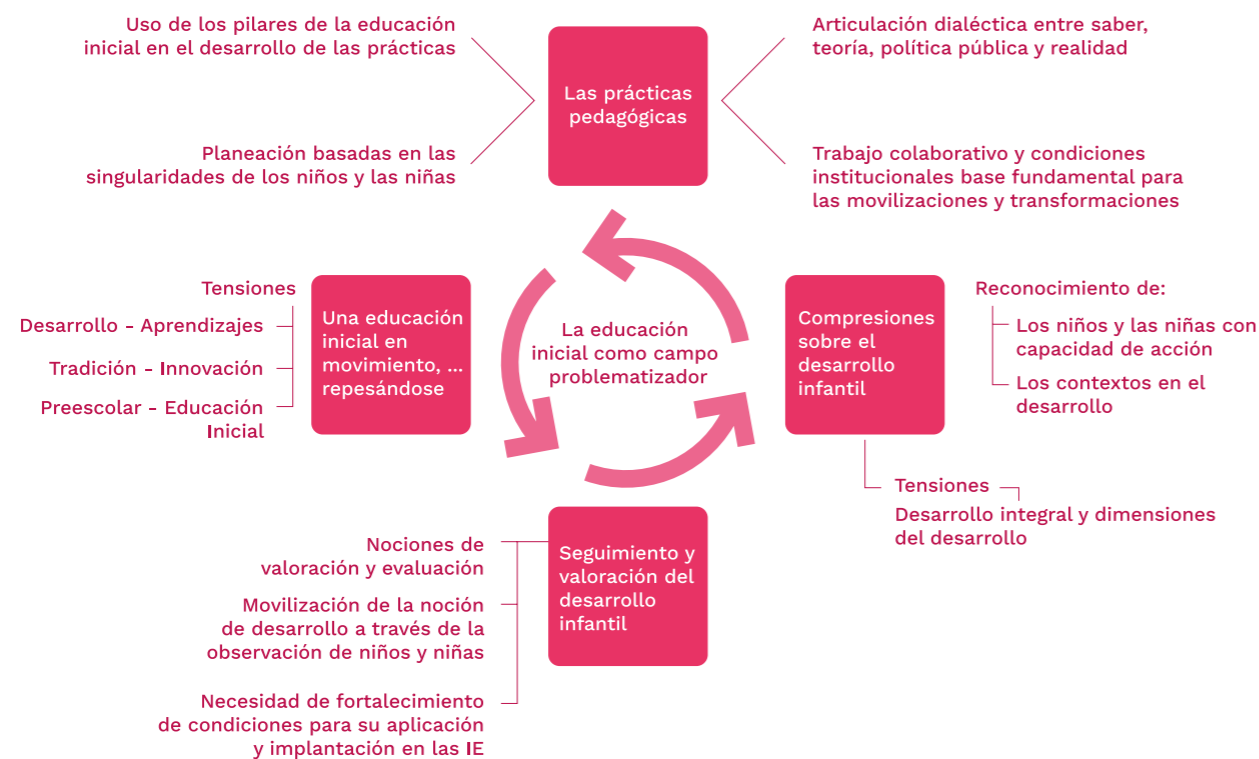
Figura 2. Categorías desarrolladas

A continuación, se da cuenta de los hallazgos armonizando el diálogo de la experiencia con algunos referentes teóricos que, como se ha venido mencionando, se encuadran en el campo de la educación inicial, en el cual se encuentra una comunidad en tensión entre la preparación para la escolaridad y la promoción del desarrollo infantil. Tensión que se va resolviendo a partir de las herramientas que las maestras y los maestros han venido creando y recreando y que también aprovechan los espacios de posibilidad para el cambio que se presentan en la vida cotidiana de las Instituciones Educativas -IE. (Figura 2)