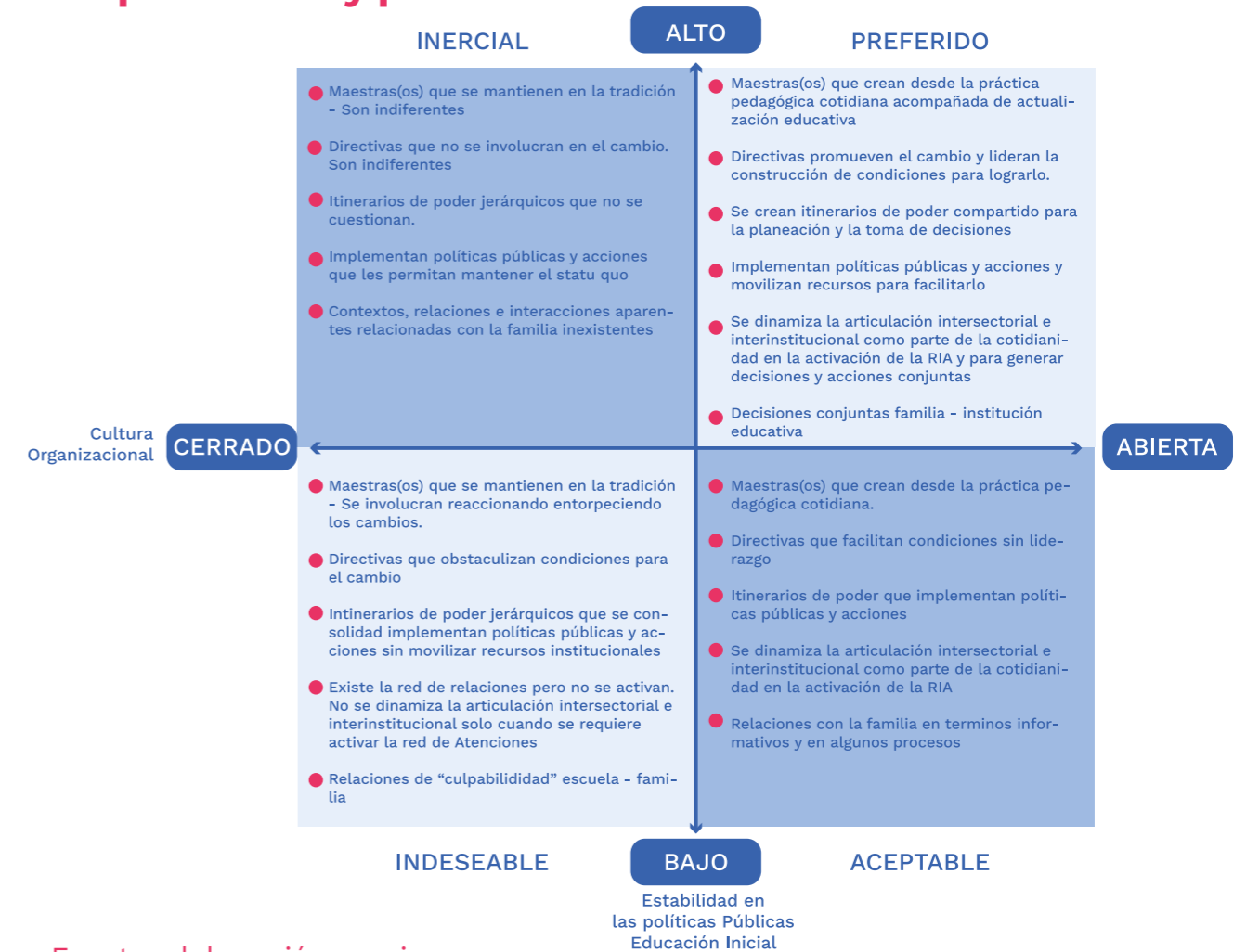
Figura 5. Escenarios posibles para favorecer movilizaciones en comprensiones y prácticas

De este modo, como se muestra en la figura 5, se encontraron diferentes escenarios a los que aquí les damos un nivel de movimiento particular: inercial, indeseado, aceptable y preferido, cruzado por dos dimensiones en las que estos movimientos se dan, la cultura de la institución educativa (abierta o cerrada) y la estabilidad en las políticas públicas educativas, que como lo perciben las maestras, les van llegando de manera inesperada y sin el tiempo suficiente para ir las apropiando.