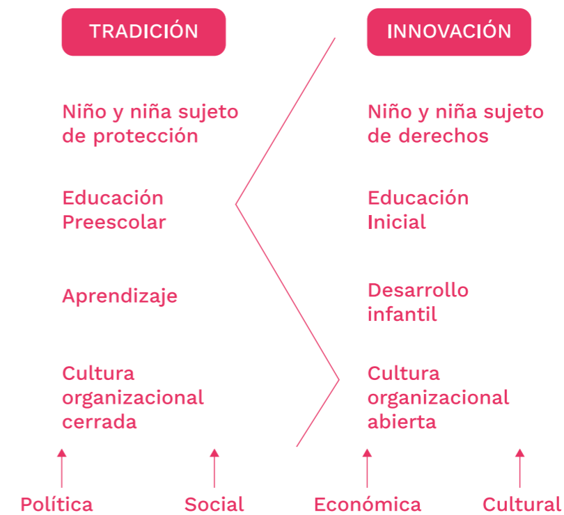
Figura 4. Ejemplo de Aspectos en tensión

Por ello, como se dijo, la tensión es protagonista en el cambio que se está produciendo, el cual implica rupturas en las interacciones dentro de la Instituciones Educativas -IE y en sus actores con coordenadas políticas, científicas, ambientales, culturales, económicas, que devienen en nuevos modos de operar de estas organizaciones. (Figura 4)